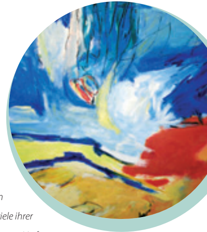
Die Dainbacher Malerin

Sollte es hin und wieder mal zu kleineren Wartezeiten kommen, können Sie im hübsch gestalteten Eingangsbereich am Kiosk einen Kaffee bekommen, eine Zeitung kaufen oder die ständige Gemäldeausstellung rund um den Patientenempfang anschauen.